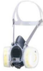
取替え式防じんマスク