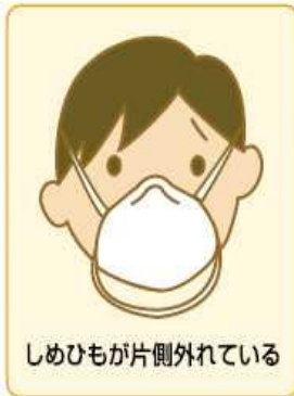
しめひもが片側外れている