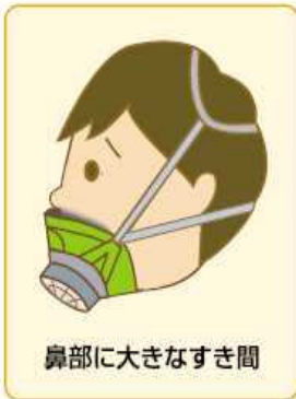
鼻部に大きなすき間