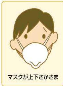
マスクが上下さかさま