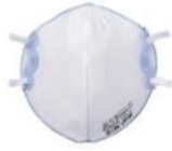
使い捨て式防じんマスク

がれきの粉じんには石綿が含まれているおそれがあります。事業者の指示に従い、適切なマスクの着用をお願いいたします。