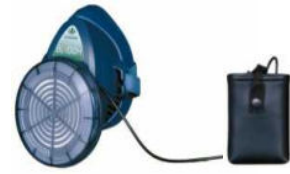
電動ファン付き呼吸用保護具