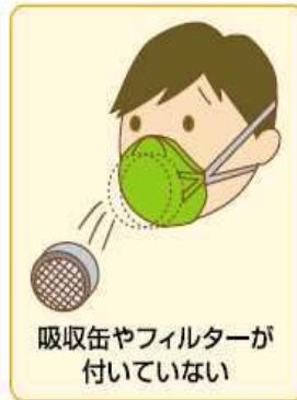
吸収缶やフィルターが 付いていない